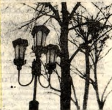
Фото учня 7-го класу Павлика Валька