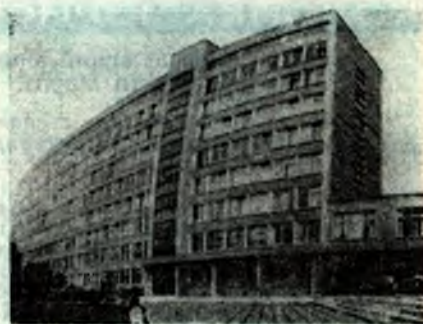
Газета Прикарпатського університету

Щасливий день для Діви — вівторок, місяць — березень, число — 4, колір — усі відтінки зеленого (категорично виключається жовтий колір в усьому: одязі, біжутерії тощо), камінь — сердолик і нефрит у сріблі і платині (ніколи у золоті).