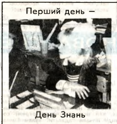
Перший день —

«Танцює осінь у багряному вінку Журавлик клетотом у вільне небо лине, Своє майбутнє, юнь палку Вітає нині ненька Україна».